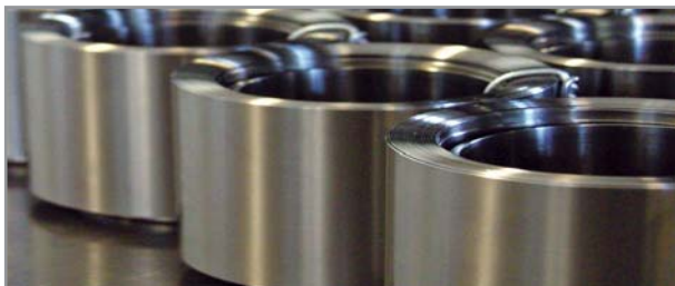
DURASPRING Silver in rostfreiem Stahl

Für den Einbau werden an beiden Endseiten der DURASPRING Spiralfeder einfache Zentrierflansche benötigt. Diese Flansche müssen die auftretenden Federdrehbewegungen zulassen, um eine Beschädigung der Federn zu verhindern. Die Federn müssen frei beweglich geführt werden und dürfen nicht verschraubt oder vernietet werden. Beim Einsatz von Flanschen reduziert sich der Spindeldurchmesser SD um 6 mm gegenüber dem Tabellenwert der nachfolgenden Seiten.