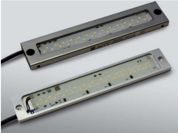
HEMA »SECRET MTL« und »SECRET MTLG« (hinten)