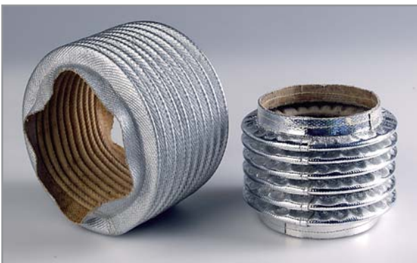
Gewebefaltenbälge mit Alu-Glasfaserbeschichtung

Im Unterschied zu den Gummischeiben-Bälgen erhält der Gewebefaltenbalg eine Strukturverstärkung, die den einwirkenden mechanischen Kräften Stand hält. Die äußere Schutzwirkung durch das Gummi bleibt vollständig erhalten. Durch das Trägergewebe verändert sich die Oberflächenbeschaffenheit, die Ebenheit der Gummischeibentypen geht verloren.