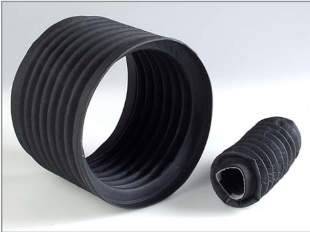
Gewebefaltenbälge mit Kunststoffbeschichtung

Gewebe-Faltenbälge eignen sich besonders für Anwendungen mit hohem Verschleiß, starken Druckverhältnissen oder höheren Temperaturen bis 200°C.